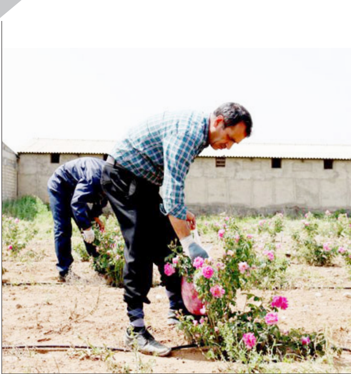
شکوفایی اقتصاد کشاورزی ماهنشان با رایجه گل محمدی