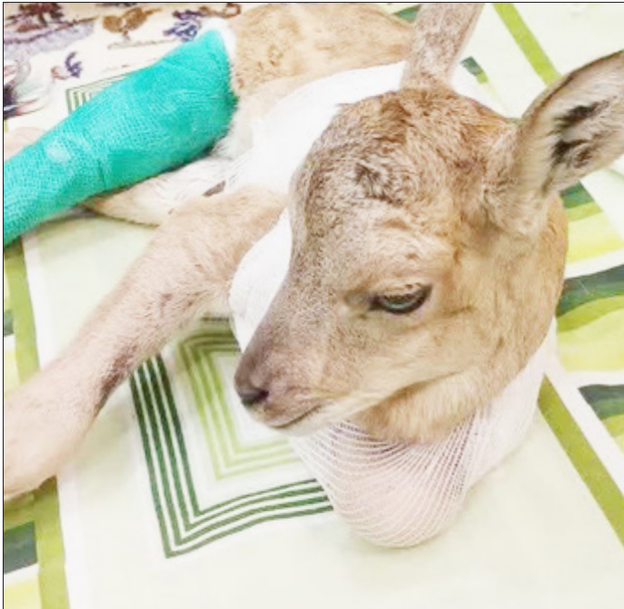
حیات دوباره برای بره قوچ ارمنی در ارتفاعات ماهشان