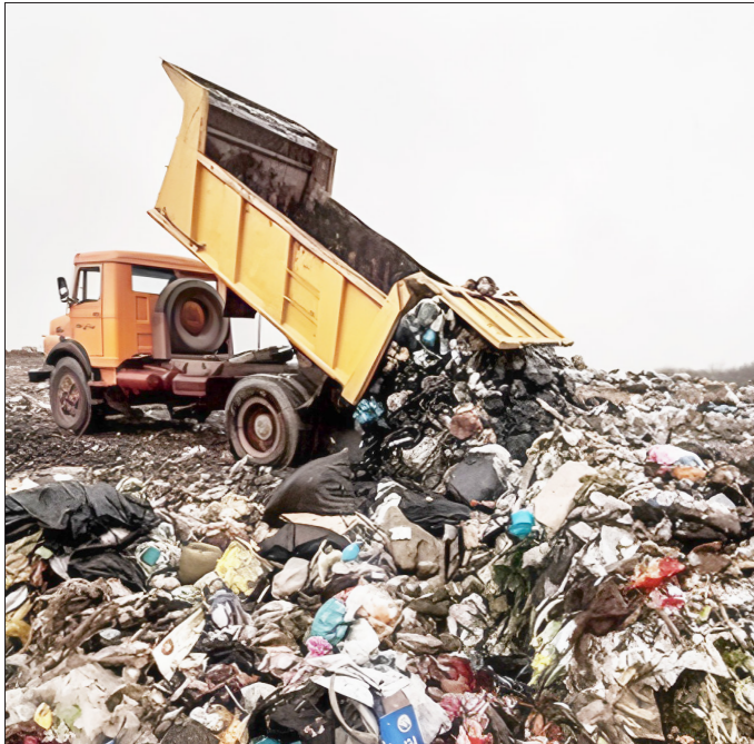
چالش زباله‌های زنجان که پایان ندارد