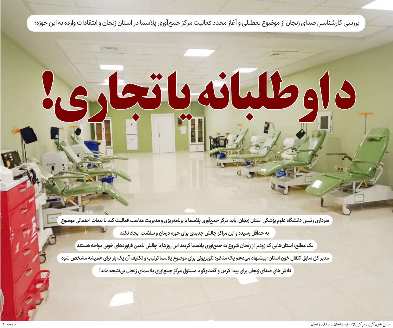
سالن خون‌گیری مرکز پلاسمای زنجان

تلاش‌های صدای زنجان برای پیدا کردن و گفت‌وگو با مسئول مرکز جمع‌آوری پلاسمای زنجان بی‌نتیجه ماند!