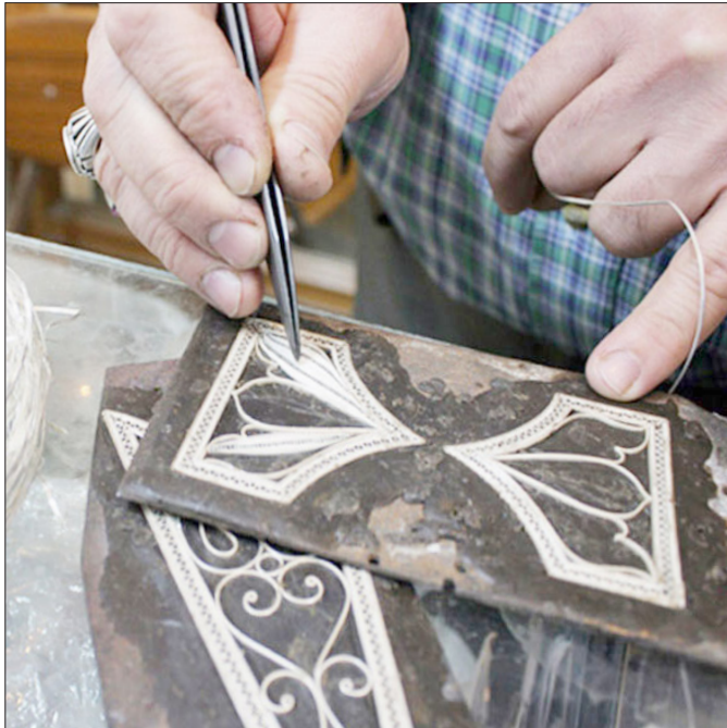
هنر ملیله کاری زنجان در نفس های آخر