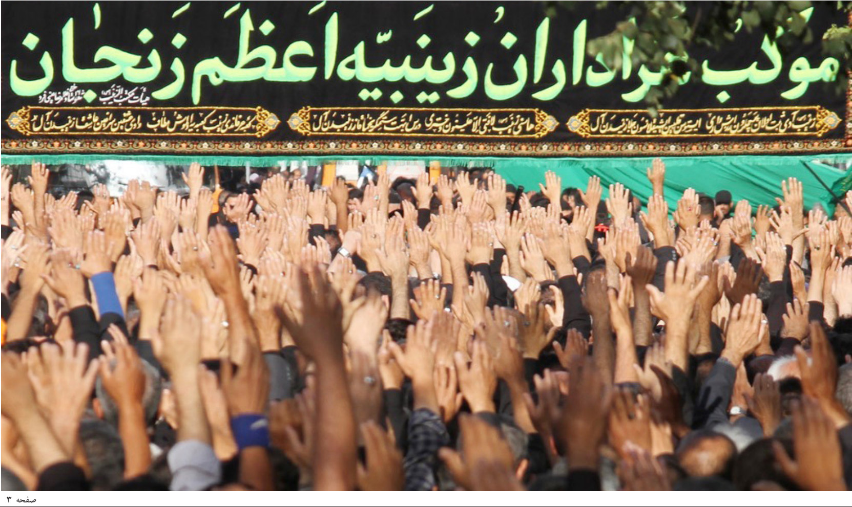
صحنای عزاداری زنجان از آیین نگهباری

رئیس هیئت امنای زینبیه اعظم زنجان: دسته عزاداری زینبیه اعظم زنجان روز جمعه ۵ تیرماه، ۱۱ محرم از ساعت ۱۵ از مقابل مسجد زینبیه اعظم آغاز می‌شود