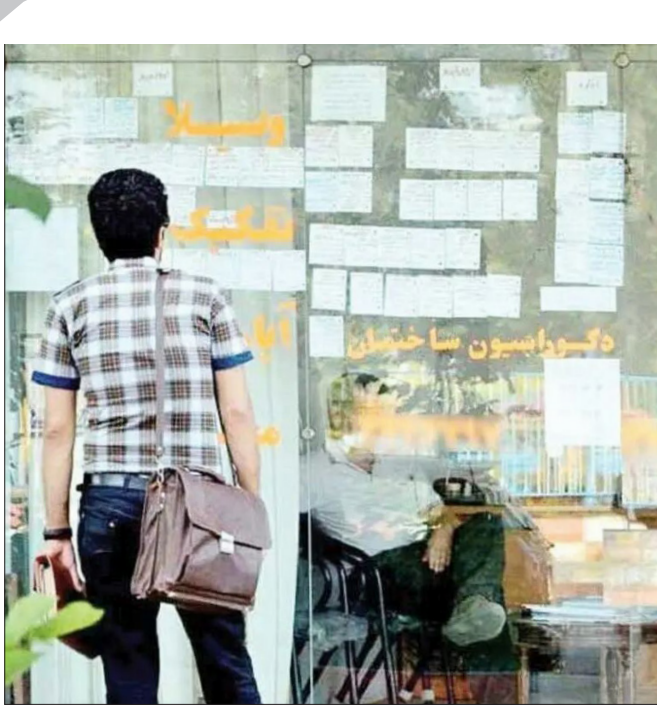
رویاهای بی‌سند؛ وقتی هشدارها در بازار آگهی‌های مسکن زنجان گم می‌شود