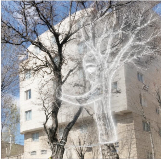
درختان زنجان، همچو بید لزان