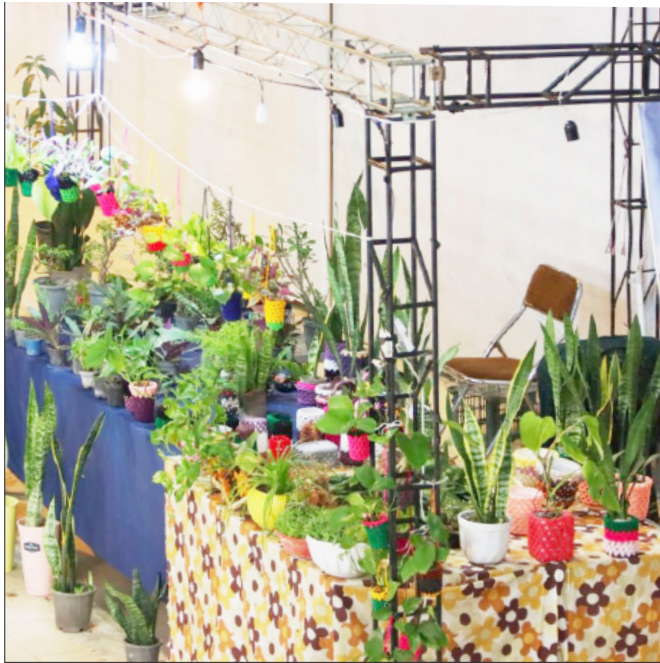
نگارنده: سید رضا