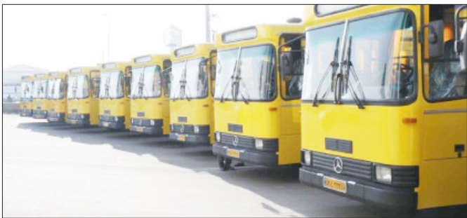
بنیاد مسکن انقلاب اسلامی

رئیس کمیسیون حمل و نقل و ترافیک شورای اسلامی شهر زنجان اضافه کرد: چنانچه بتوانیم در کنار خرید ۱۵ تا ۲۰ دستگاه جدید، این خودروهای متوقف شده را نیز تعمیر و به ناوگان بازگردانیم، ۵۰ تا ۶۰ دستگاه خودرو دوباره در خدمت شهروندان قرار خواهند گرفت که این امر تأثیر بسزایی در بهبود کیفیت حمل و نقل عمومی شهر زنجان خواهد داشت.