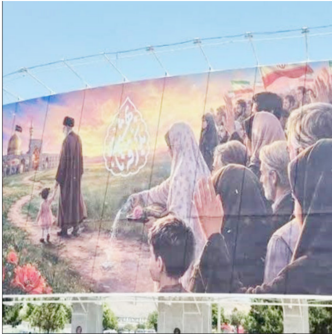
دیوانرگار میدان ولیعصر «بدرقه تا بهشت» در زنجان