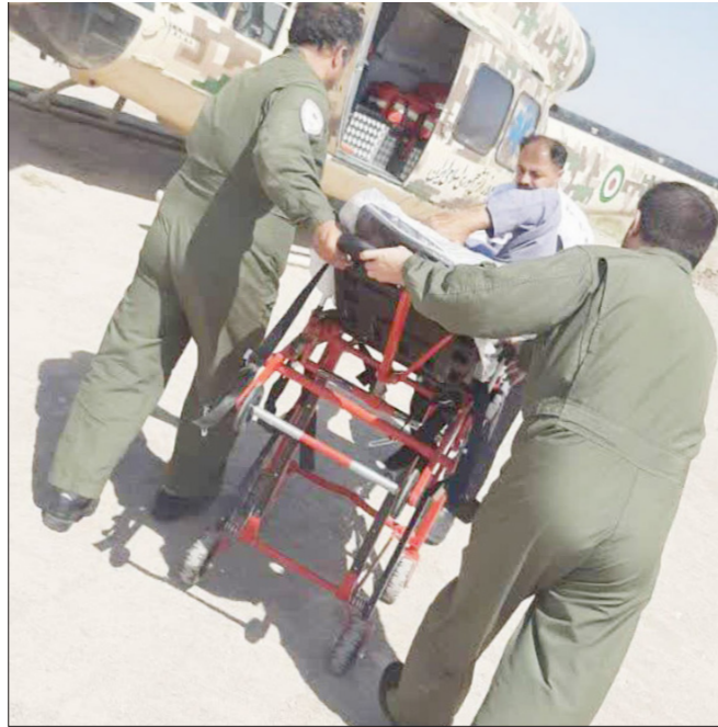
پرواز بالگرد اورژانس زنجان برای نجات جان بیمار قلبی - ۱۶ تیرماه ۱۴۰۵