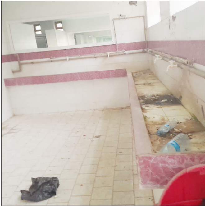
وضعیت نامناسب سرویس بهداشتی گاوزنگ